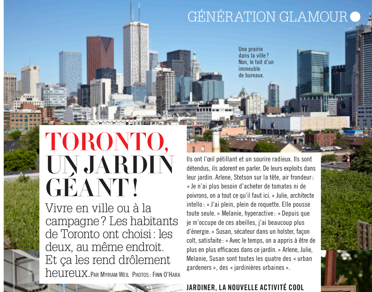
Une prairie dans la ville? Non, le toit d'un immeuble de bureaux.