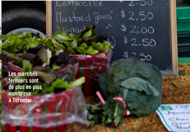
Les marchés fermiers sont de plus en plus nombreux à Toronto.